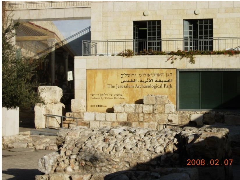
耶路撒冷考古公園入口（攝影：張百路 2008 年）

前往聖地以色列的基督徒，通常會去「耶路撒冷考古公園」(The Jerusalem Archaeological Park，又名 Ophel Garden 俄斐勒廣場)參觀。在其內，有一個非常引人注目的考古遺址，就是「戶勒大門」(Huldah Gates)。