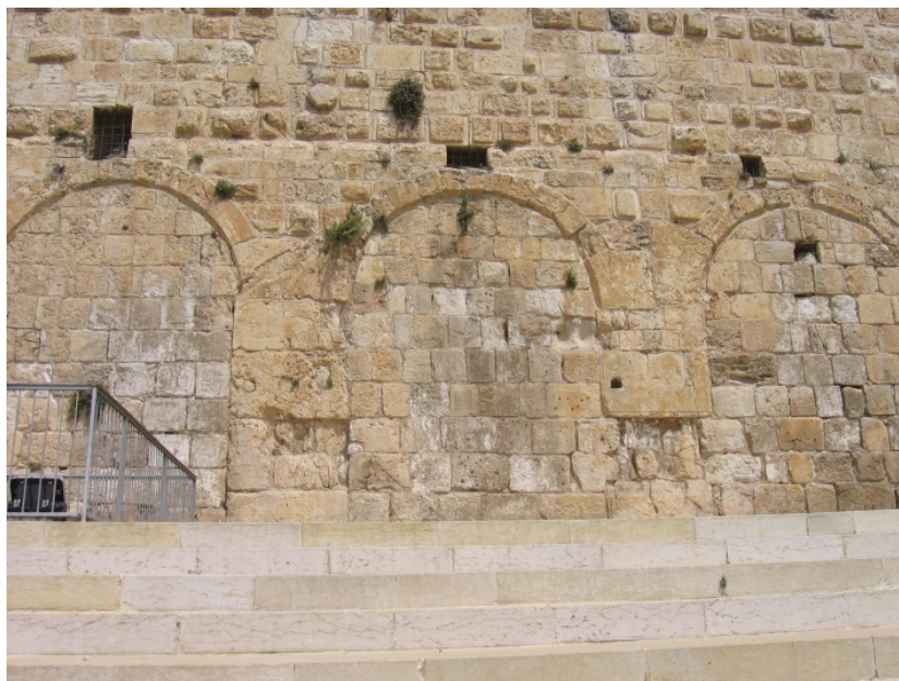
戶勒大門東邊那一組的三拱門