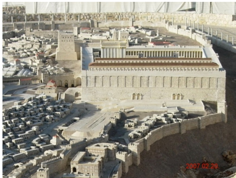
俄斐勒及通往聖殿區模型的戶勒大門