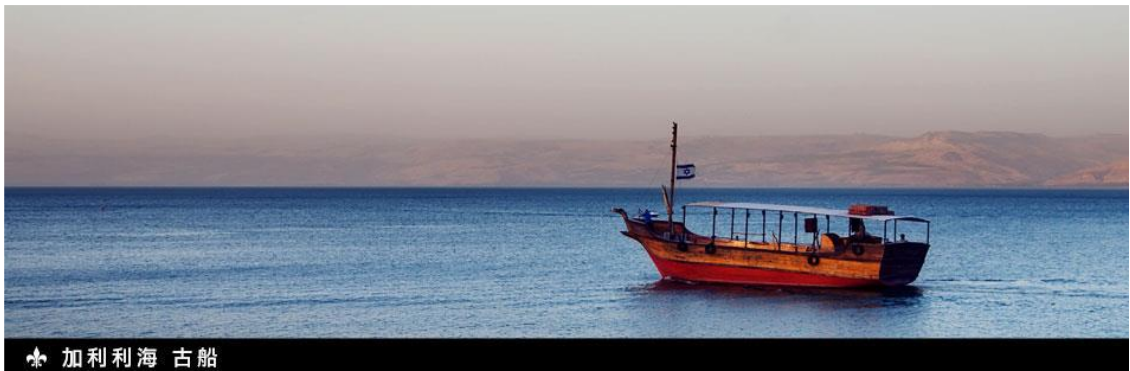
✦ 加利利海 古船