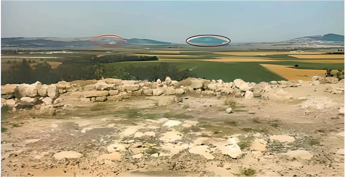
圖2：南往北望，紅色圈是位於加利利山脈的拿撒勒山，啡色圈是他泊山 3