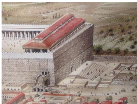
從西南方觀看聖殿山南牆的繪圖 [劉歷志譯]