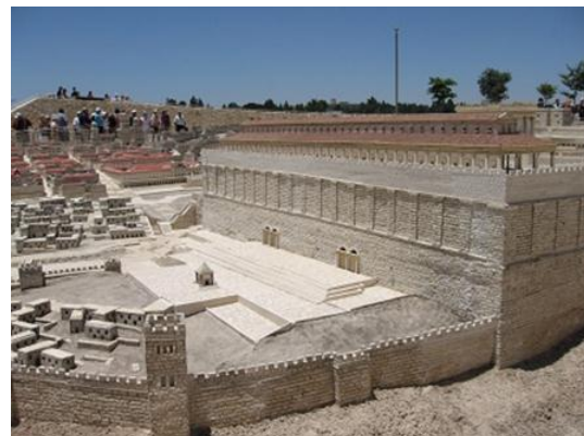
從東南方觀看聖殿山南牆的模型圖片