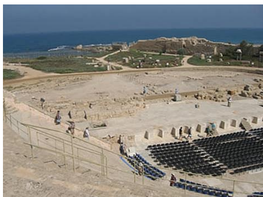
從該撒利亞的劇場遠眺海邊的宮殿遺蹟。