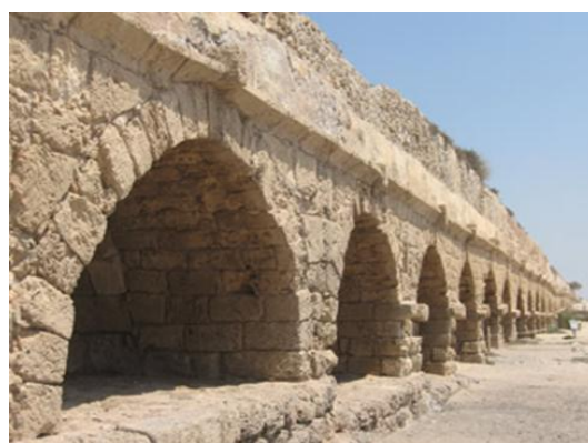
該撒利亞的引水道。