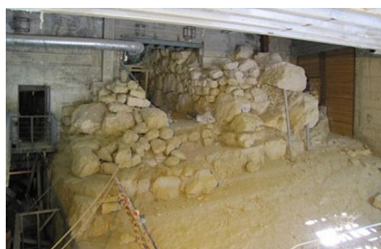
基訓泉塔樓的遺跡，為保護泉水而建造