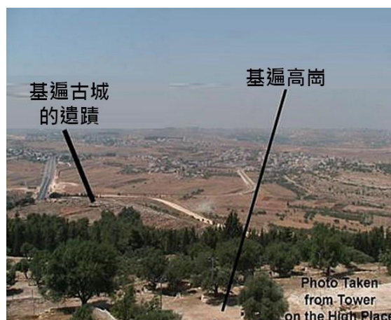
左圖 Galyn 從位於基遍南方的基遍高崗上的塔樓向下眺望基遍。