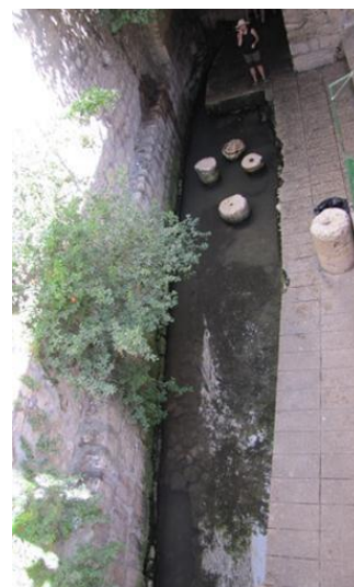
拜占庭西羅亞教堂遺留的圓形石柱。