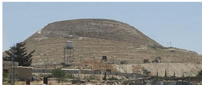
左圖 希律堡的周圍，從上到下，全用扁平的石頭覆蓋，有如盔甲似的。 右圖 希律堡全貌