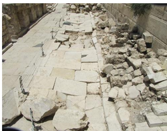
向北望，商店在兩旁