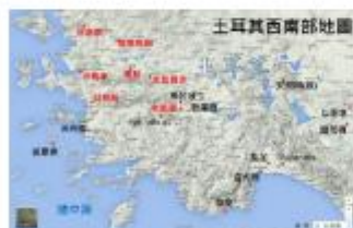
土耳其西南地圖 Map of South-Western Turkey