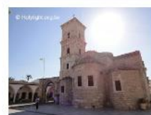
Church of St. Lazarus, Lamaca 拉納卡拉撒路紀念