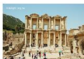
土耳其以弗所古城宏偉的 Celsus圖書館遺蹟