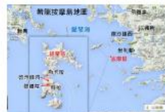
希臘 Greece 拔摩島地圖 Map of Patmos Island