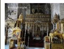
Church of St. Lazarus, Lamaca 拉納卡拉撒路紀念