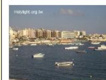
馬爾他Malta : Bay of St. Paul Bay 聖保羅灣一景