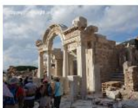
土耳其, 以弗所 Ephesus, 羅 馬王哈德良廟 Temple of