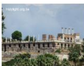
以弗所聖約翰大教堂 (Basilica of St. John, 第六