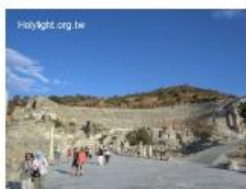
土耳其以弗所古城大劇場 (Great Theater) 的港口