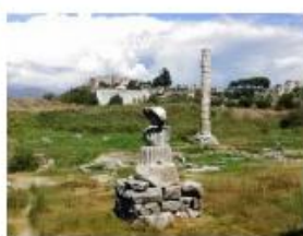
土耳其以弗所著名的亞底米 神廟 (Artimus Temple, 主前