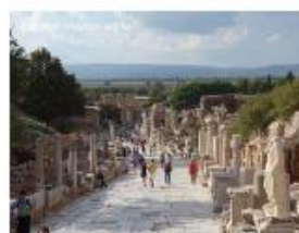
以弗所 Ephesus, Curetes 大道